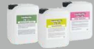
Reiniger FK 11, FK 12 und FK 39