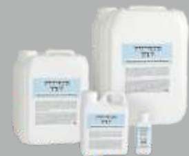
Multifunktionsprodukt FK 7